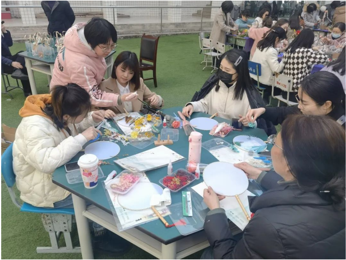
一花一世界 一扇一团圆——手工扇制作