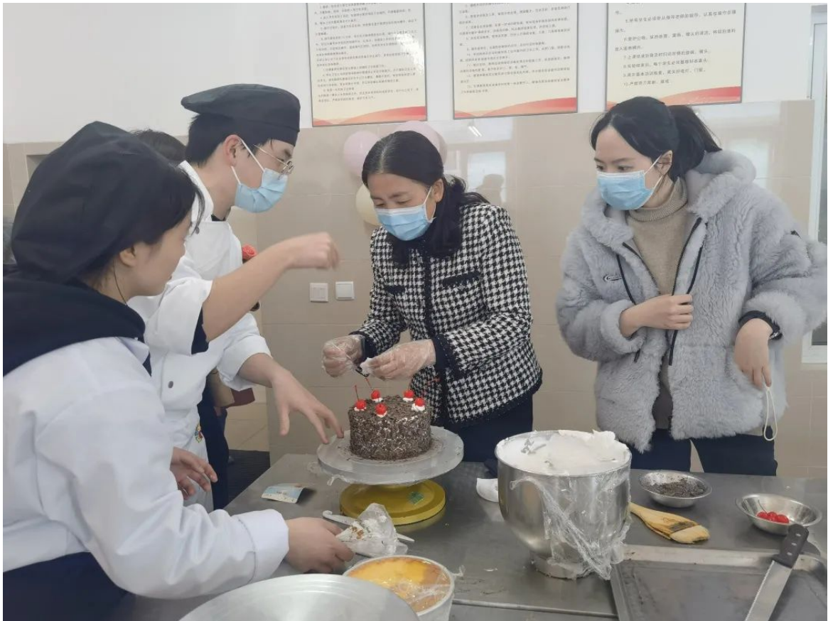
快乐加油站——甜品烘焙