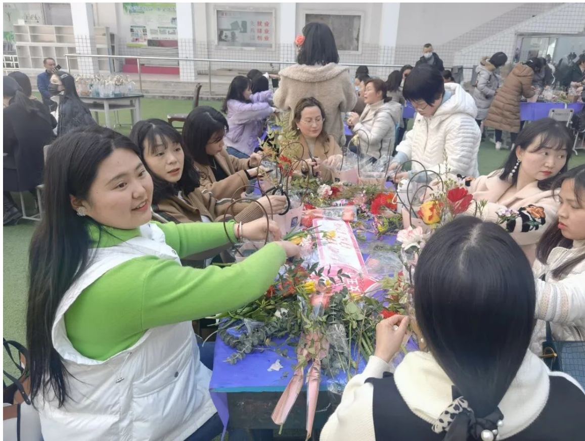
定格花香，绽放优雅——插花艺术