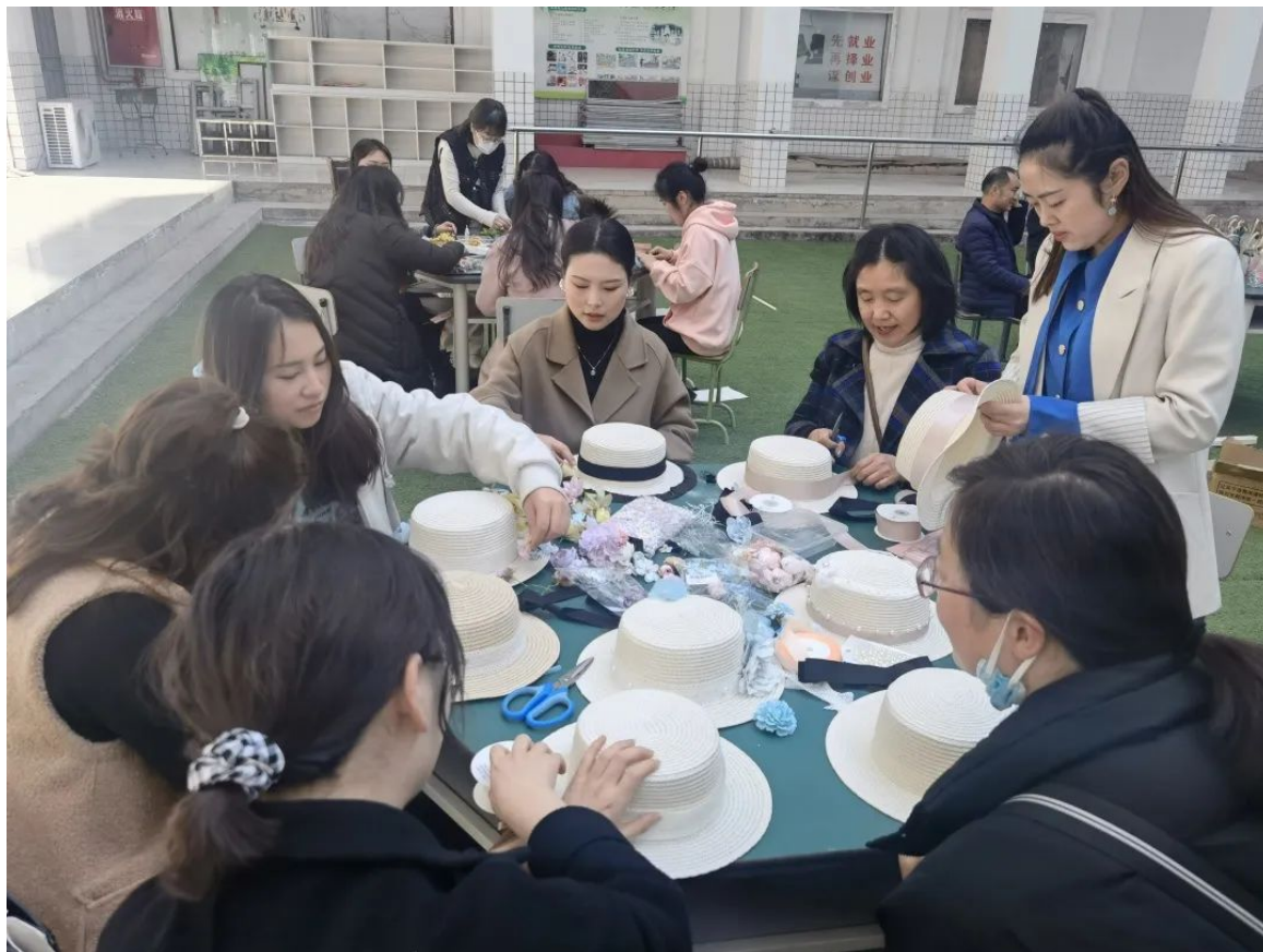
阳光下的一抹阴凉—手工帽制作